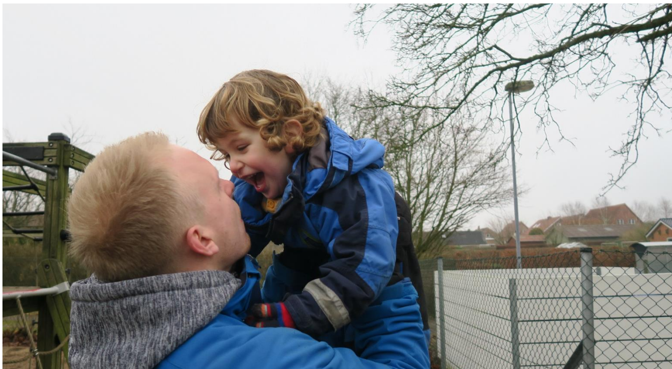
Når man bliver fanget af den farlige trold, der ligger på lur under broen!

Se i øvrigt opslag ved hhv. vuggestuens, børnehavens og skolens indgange.