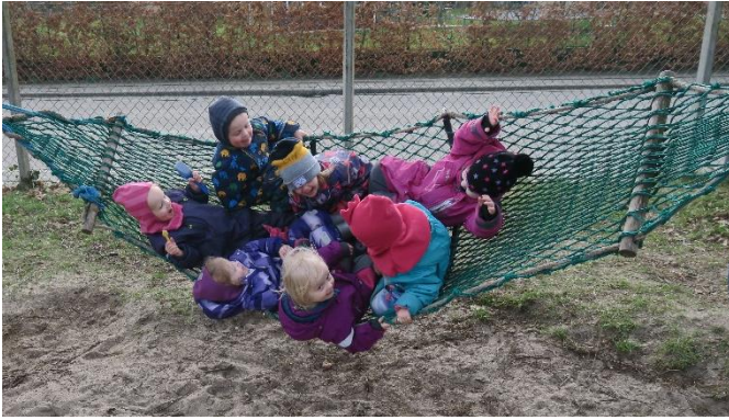
En vild tur i hængekøjen nydes i det dejlige solskin.