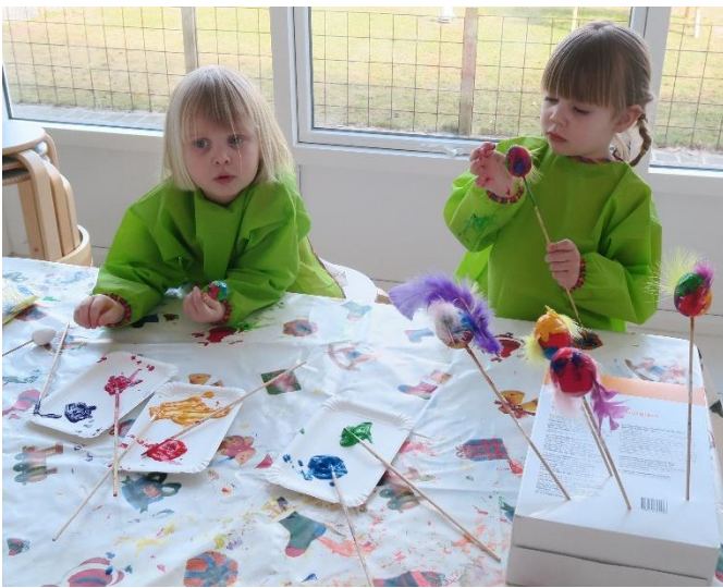
Det kræver koncentration at håndtere fjer, maling, lim og vat.